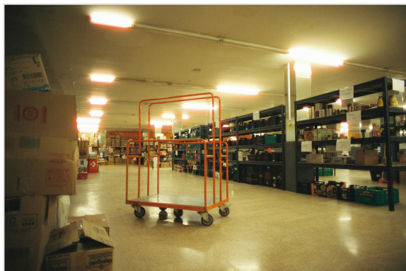
Vista general del interior del almacén - punto de control