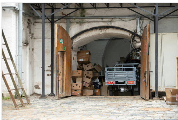
Zona de carga abierta con sellado insuficiente

Falta de hermeticidad en el paso de tuberías por la pared del sótano. Juntas de la puerta de entrada dañadas.