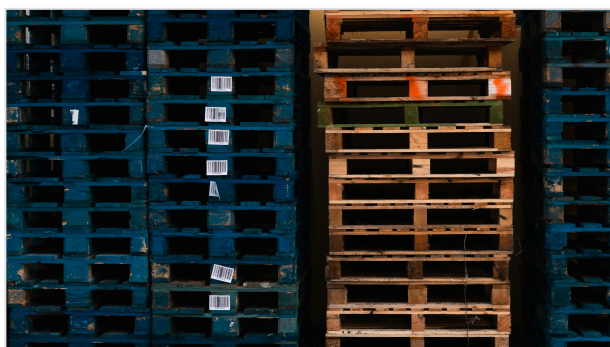
Almacenamiento incorrecto en paletas

El personal no ha sido formado en procedimientos ante la presencia de plagas. Falta el calendario de inspecciones.