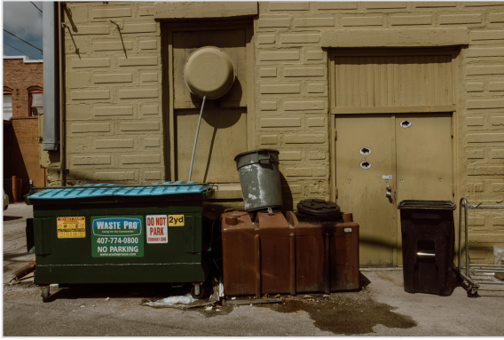
Contenedores de residuos junto a la pared del edificio